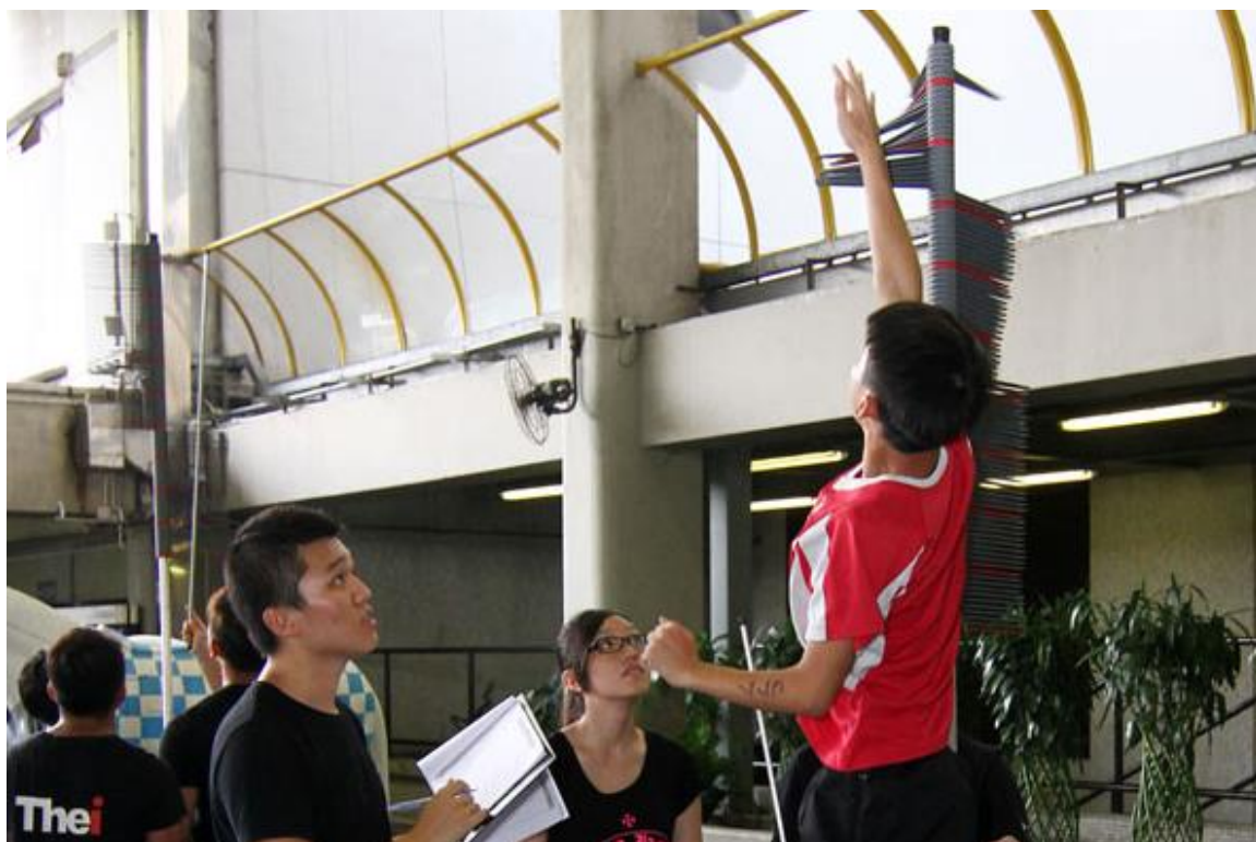
(爆发力测试，立定跳远项目为备选项目)