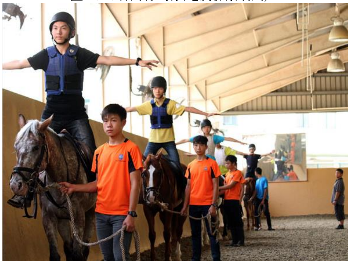
(骑马体验：考生需在马背上完成一些简单肢体动作)