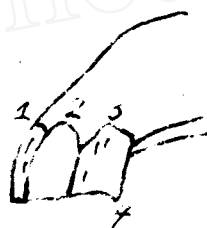
图 2 8 岁马唇面上牙切齿

此外,还可通过上牙鉴定 8 岁马的年龄,马长到 8 岁,上牙边缘切齿后缘磨出个突出部,人们通常把它称之为“燕尾”(见图 2)。